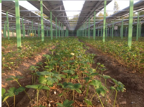
明日葉 ソーラーシェアリング